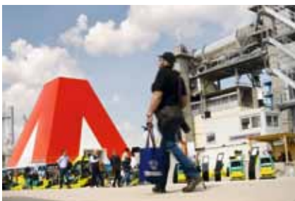
Eine globale Marke