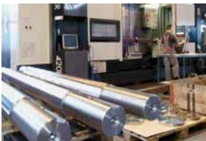
Herstellung mechanischer und elektronischer Herzteile