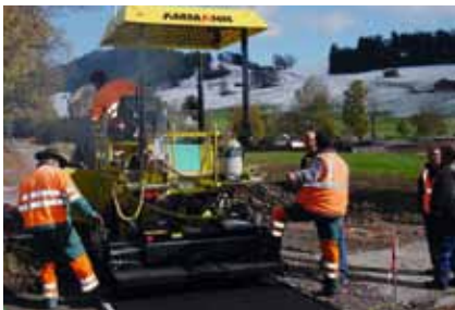
Strassenfertiger AFW 270