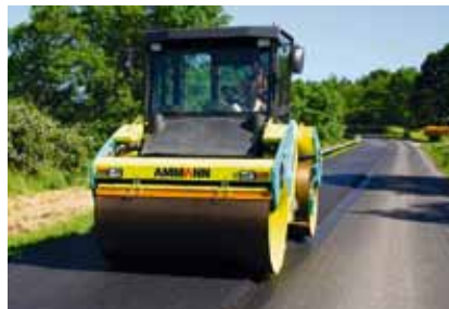
Knickgelenkte Tandemwalze AV 120X